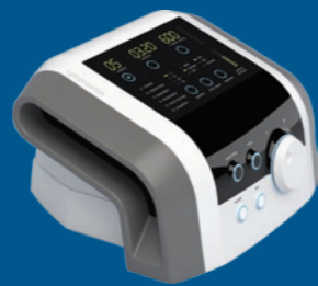
BTL-6000 Lymphastim 6 EASY