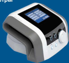
BTL-6000 Lymphastim 12 TOPLINE